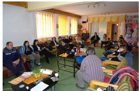
Events im Haus der Hoffnung